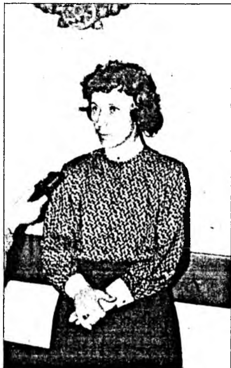
баримталан, ухаан бодолые хүгжөөхэ гэхэн гол зорилготой литературы хэшээл нурагсалай энэ методико онсо хуури эзэлнэ.

Хүүгэн бүхэнэй оюун бодол онсо илгаатай, дабташагүй, тэрэниие