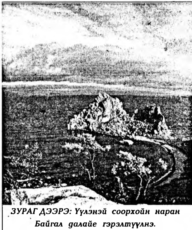
ЗУРАГ ДЭЭРЭ: Үүлэнэй соорхойн наран Байгал галайе гэрэлтүүлнэ.