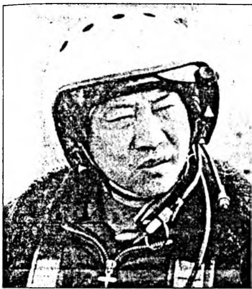
Россин Герой, Россин Федерациин габьяата лётчик-туршагша Олег Григорьевич Цой.

Энэ хайндэртэ Буряад орон ямар хамаатайб? Манай дэбисхэр дээрэ космодром үгы гэбшье, нютагаймнай нэгшье хүбүүн космонавт боложо шадаагүйшье наань, республикийн угаа олон зон энэ үдэрше өөрынгөө хайндэр гэжэ тэмдэглэдэг ха юм.