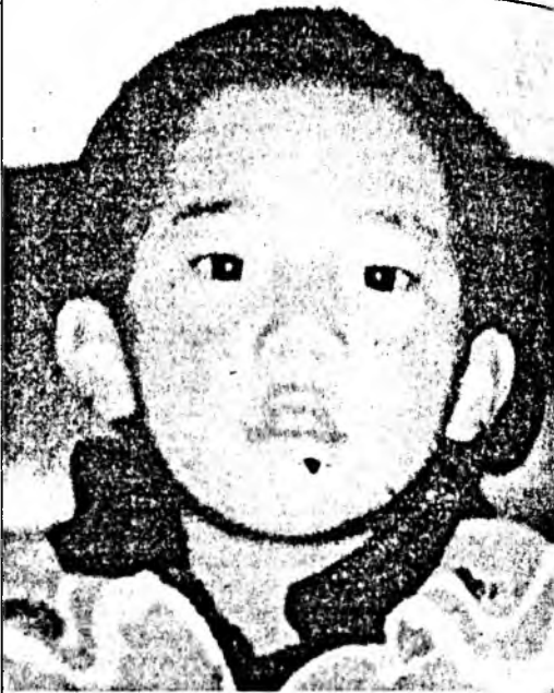
11-дүгээр Банчан Эрдэни - Гендун Чойжи Нима

11-дүгээр Банчан Эрдэни - Гендун Чойжи Нимые Хитадай түрмэһөө сүлөөрүүлхын түлөө Буряадай буддын шажантанай гурбан үдэрэй үлэн байдал апрелин 25-да үглөөнэй 9 сагта Улаан-Удэдэ танк-хүшөөгэй дэргэдэ (Илалтын проспект) эхилхэ. Олоной хабаадалгатай нээлгын ёһолол-жагсаал үдэрэй 12 сагһаа болохо. Үлэн байдал апрелин 25-27-ой үдэрнүүдтэ үргэлжэлхэ.