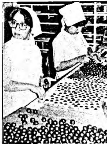
Резервы и возможности для этого есть.

Как ведущему предприятию в республике, развивающемуся, Правительство наше, наверное, предоставило ОАО «Амта» какие-то местные льготы?