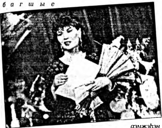
гэмжэһэн команданууд олон байгаа гэжэ тэмдэглэлтэй. Сэсэн ухаатай, бэлиг талаантай багшанарай гундаһаа эгээл бэрхыень шэлэхэ гэсшэ хүндэ

Конкурсын түгэсхэлдэ театр соо багша бүхэн уран бэлигээ харуулба. Эндэ өөһэдүнгөө багшые