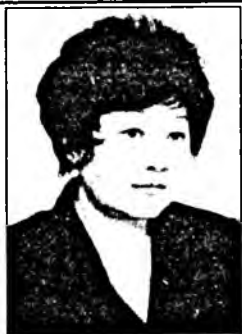
ЖЕРДЕВСКЭ 57-гохи ОКРУГОЙ ХУНДЭТЭ ЛУНГАГШАД!