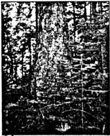
Ровесница лесного департамента - двухвековая лиственница