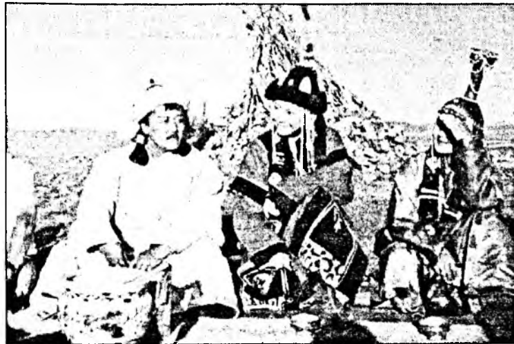
Кадр из фильма «Мандухай - мудрая царица».

Как мы знаем, дни культуры города-побратима Дархан совпали с празднованием Дня города. И, может быть, поэтому почти незамеченным многими жителями прошел в эти дни показ кинофильмов монгольских кинематографистов. На суд зрителей были представлены такие известные фильмы, как «Мандухай - мудрая царица», «Сын вечного неба», «Исход». К сожалению,