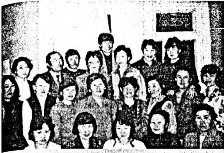
Шэрэнгийн хургуулийн багшанар