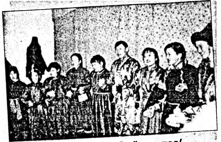
Ёохор наадан хайхан даа!

АВТОРНАА: Нагаса эжы Дымит-Ханда Эрдынеевна Батуеваһаа бэшэжэ абааб.