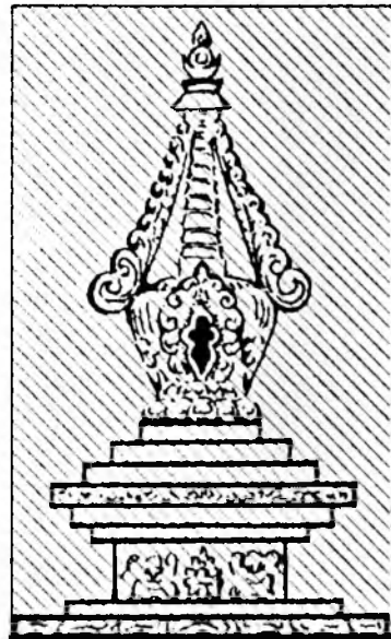
просьбой к начальству.

В этот день не стоит строить дом, брать собаку, рыть колодец, землю, кроить одежду,