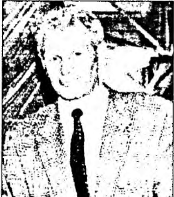
мурьсөөн хадаа мурьсөөн ха юм даа.

ТОКИОДО үнгэргэгдэһэн XVIII Олимпын наадануудта хабаадахадаа, нотагаймнай хүбүүн һайн бэлдэхэлтэй байгаа. Тэрэ хүнгэн шэгнүүртэй дунда гэхэ гү, али 60 килограмма гурбан уулзалгада илаад, түгэсхэлэй мурьсөөндэ гараа нэн. Велингтон Баранников алтан медальда хүртэхые оролдоһонһыс, түгэсхэлэй мурьсөөндэ, сэхыень хэлэбэл, үрөөһон гараараа тулаадаха баатай болоһон байгаа бшуу. Ушарын юуб гэхэдэ, урда тээхи уулзалгын үедэ гараа гэмтэлхэн байгаа. Тийгэжэ суута польско боксер Юзеф Грудзень илаата туйлаа нэн. Тээд яахаб даа,