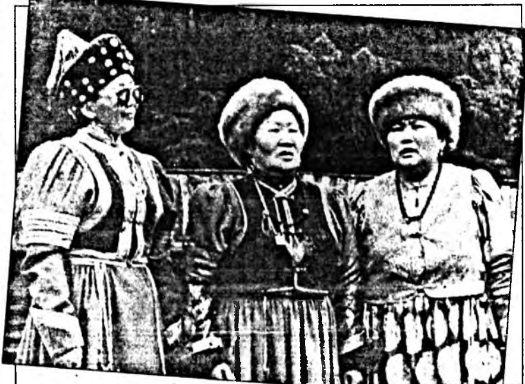
А.Вейгель хайшалжа, выставкэ нээгдэбэ гэжэ мэдүүлээ юм. Июнийн 29-30-най үдэрнүүдтэ симпозиум 5 секци боложо хүдэлөө. «Фольклор болон олонийтэ» гэнэн секцие Зүүн

Июлийн 4-дэ Улаан-Үдэ хотын этнографическа музей соо «Байгалай уулзалганууд-98» гэнэн сэхэ найр наадаар тус симпозиумдүүрээ. Эндэ хүндэтэ айлшад зүүн, баруун буряадуудай, эвенкнүүдэй, шэмээшэгүүдэй, хасагуудай ёһо заншал болон аман зохёолыень һонирхожо шагнаһан, хараһан байна. Урданайнгаа ёһо заншал мартангүй, саашань улам хүгжөөжэ байһан Хяагтын аймагай хасагуудта, Агын тойрогой Зүдхэлийн фольклорно ансамбльдаа, «Арадай сэдхэл» ансамбльдаа, Зэдын аймагай Зэлтэрын хасагуудай хоорто, ВСГАКИ-гай инструментальна ансамбльдаа дипломууд барюулагдаа.