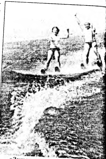
«Зундаашье санаар холжор аргатайбди!»