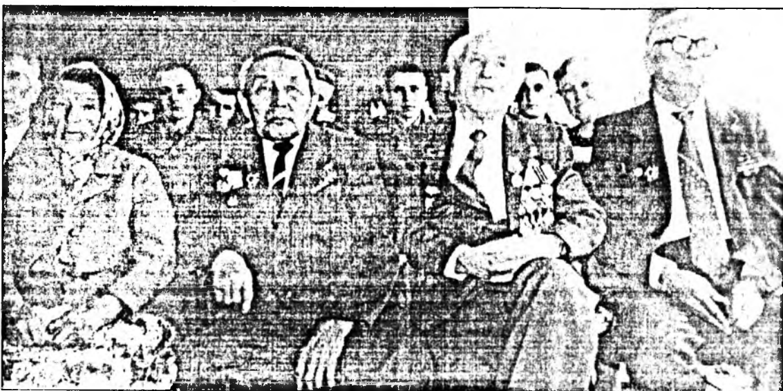
Курскын байлдаанай ветеранууд.