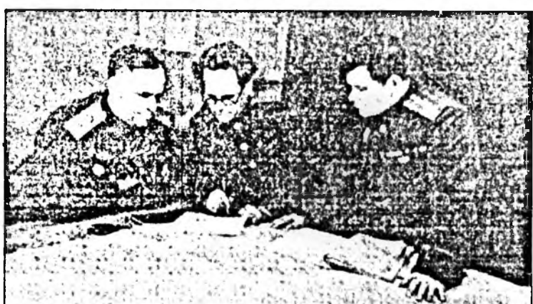
Г. К. Жуков, А. Н. Боголюбов, Н. Ф. Ватутин добтологын урда тээ.

гэдэргээ суухариха баатай болодог хэн. Курска дүхэриг шадар аяар табин хоногой туршада үргэлжэлһэн энэ байлдаанда Совет арад, тэрэнэй Зэбсэгтэ Хүсэнууд илажа, бүхы орон соомнай хэды ехэ баяр болодогыё фронтуудай илалтануудта