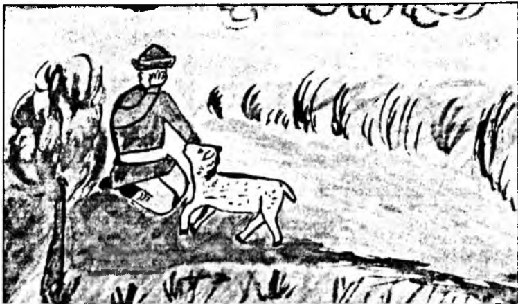
"Үншэдэй үхэл". Цагаатайн гунда хургуулин 7 - дохи классай хурагша Л.Галсанова.

Үбэл - сагаан хүгшөөдэй Саһан хүрэнгөө бүлэнэ. Үүлэн сагаан тэнгэриһээ Сагаан айрагаа сүршэнэ. Шэдитэ хадагаа намируулаад, Шэлье шэмэглээл даа. Сэнгэжэ ябаһан бидэнэй Шэхэ, хасарые шэмхээл даа. Люба САНЖИЕВА, Гэгээтэйин дунда хургуулин 10 - дахи хурагша.