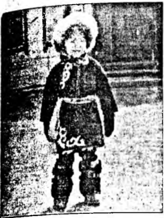
Ёготой буряад бэшэ гүб?!

Эгээлэй нүхэдэй үүсхэлээр Эхилжэл табигдаа үргөөмнай. Июниин Сугандын зууршалгаар Эгэтэдээл баталагдаа дасамнай.