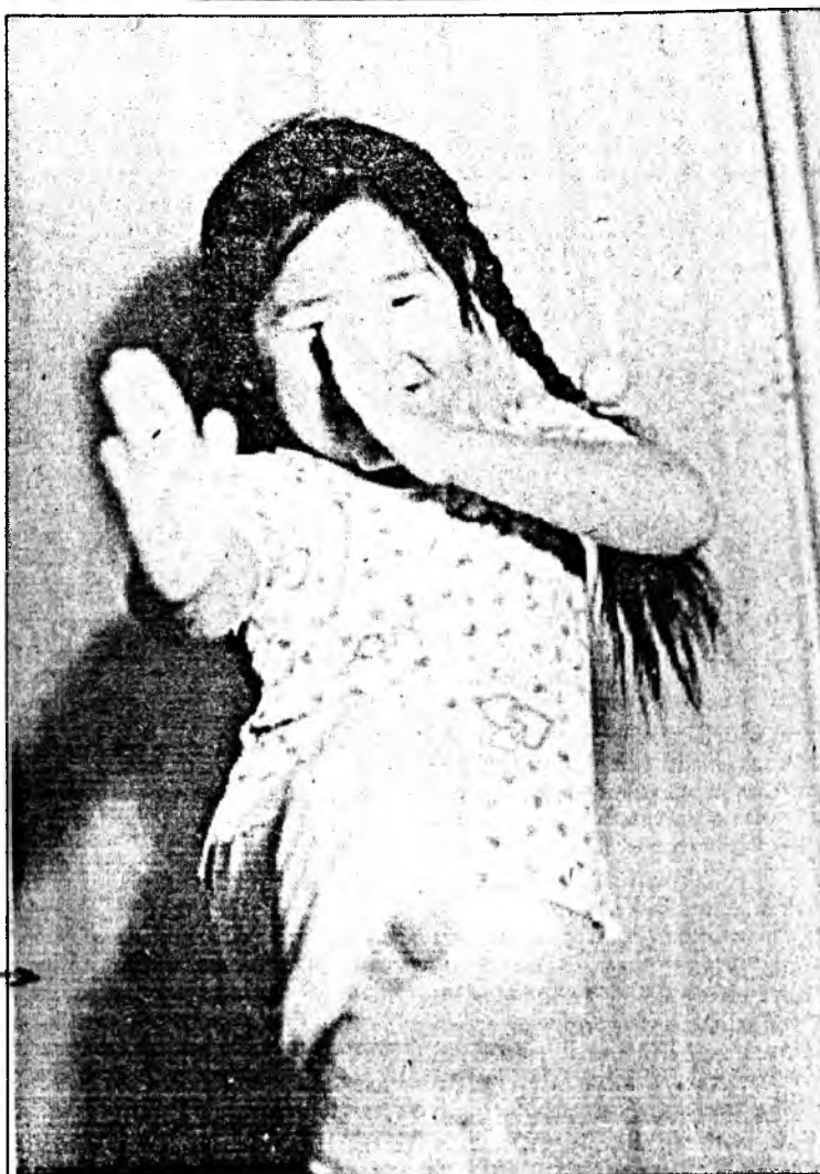
Зүүн зүгэй тулалдаануудай нюуса аргуудта һуража...

Эндүүржэ болошогүй эрлигэй харгы, Эбдэжэ болошогүй бурханай зарлиг.