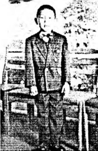
дүүргэхэгүй хаб даа. Жэшээ болгон, аша хүбүүн хүншэн эжы хоёрой хөөрлөө дурадаһуу. - Эжы, галай заяана гэгшээтэй галайнгаа носожо эхилхэдэ, шатадаггүй юм гү? - Шатажа байхаар бэлтэй бэлтэ юм ааб даа. - Бэегүй аад, хаанаһаа шодэтэй юм? Хурса үзүүртэй түлээ, зомгоһоор шодынь тэлэхэт гэнэ гүбта? - Галай заяана гэгшэһэн манай шодэндэ харагдахагүй бурхан гэгшээ, - гэхэ мэтээр эжынь ойлгуулхыё оролдобо. Ашамни алтан дэлхэйдэ мүнцэлжэ, хүншэн аба, эжынгээ сэдхэлдэ эсэгт тариха, эльгэ зүрхэнэйнь хүбшэргэй хүдэлгөөл үгйн дэжыё үргэжэ, эхэ зургаан зүйлэй үйлэ бүхэндэ баясаха һүдэ зориг бадаруулаа. Амин голһоом сентэйхэн Амгалан хоорхэн ашамни Арад түмэндэо суутай Абай-Гэсэр болоһон аад, Буряад орондоо мэдээжэ, Буруугаа адуулдаг ажалтай, Булархай хурдан бодолтой Будамшуу гүүдэлхэл зэргэтэй. Ц.Х. ЖАМБЯНОВА, хүгшэн эжынь.