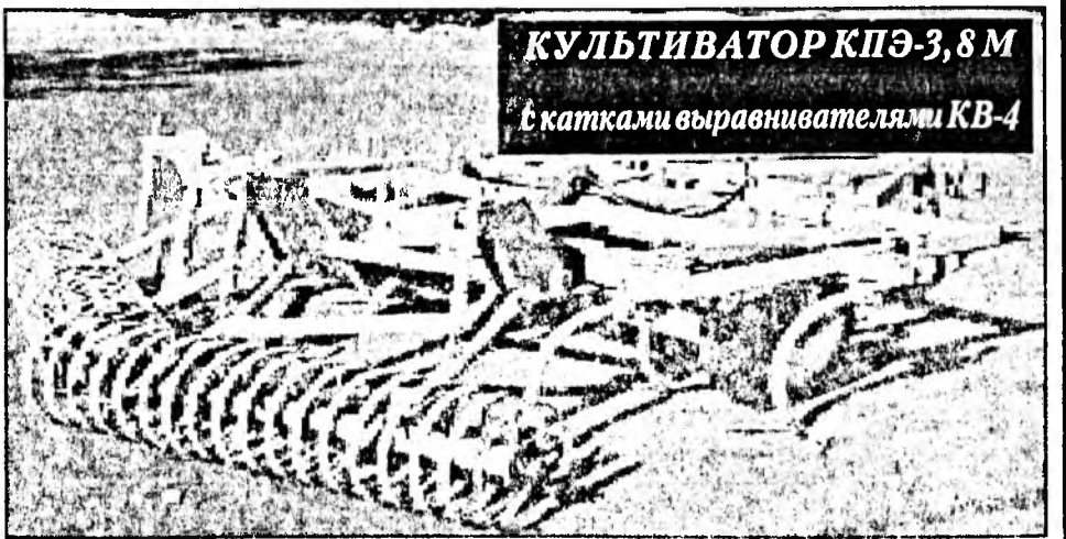
КУЛЬТИВАТОР КПЭ-3,8М с катками выравнивателями КВ-4

КОНТАКТНЫЕ ТЕЛЕФОНЫ: (3012) 21-96-62 - Генеральный директор; (3012) 21-28-03 - зам. генерального директора по производству и экономике; (3012) 21-63-00 - зам. генерального директора по коммерции, снабжению и общим вопросам; (3012) 21-33-55 - служба маркетинга и сбыта; (3012) 21-96-62 - факс.