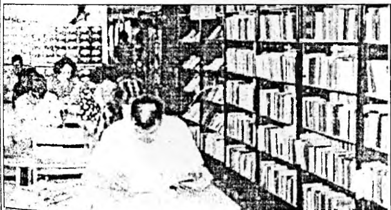
Окружной библиотекын читальна зал