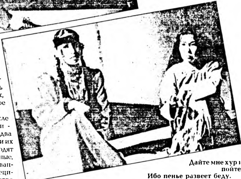
Дайте мне хур и пойте,