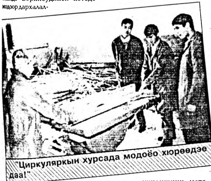
"Циркуляркын хурсада модоёо хирөөдээ даа!"

һын нурагуули нээгдэе бэлэй. Нэн түрүүн оройдоол 15 үхибүүд нуража эхилэе нэн. Юных Коммунаров гудамжын 45-дахи гэрэй хоёр багахан таһалга соо нурагшад нурадаг байгаа.