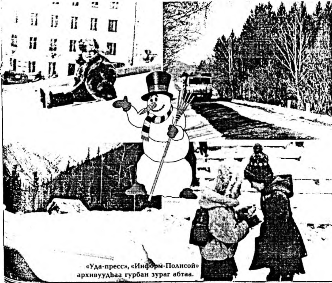
«Уда-пресс», «Информ-Полисой» архивуудһаа гурбан зураг абһаа.

Галина БАЗАРЖАПОВАГАЙ шүлэг. Филипп ХАБИТУЕВАЙ фотоколлаж.