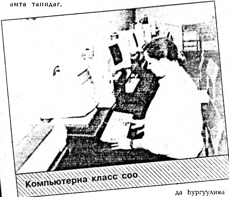
Компьютерна класс соо

Һүүлшын үедэ училищи эколого-этноическэ шэглэлээр эдиришүүлье нураха комплексно программа абаад байна. «Энэ программа ганса үхибүүдтэ бэшэ, багша, мастер бүхэндэ хэрэгтэй гэжэ һанагдана. Тус программаар хүбүүд, басагадта,