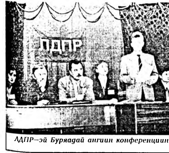
ЛДПР-эй Буряадай ангиин конференциин үгэдэ. 19.12.98 он.