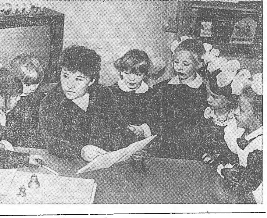
хараалагдаана. Тинхэдэ лотерейн тираж хоёр удаа — зоһон нэгэ-гэнэй, ноябрин 2-ой үдэр-нуудат Улаан-Удэ хотодо үн-гэрэгдэхэ болоо.

Үсгэлдэр Закаменск хотын Советүүдэй төлмэй дээрэ Са-гаан морин жэлэй угтамжын найр наадан үнгэрэгдэбэ. Найрдаар программада райо-ной уран найханай бүлгэмүүдэй коллективүүд Буддын литээр буряад жэлүүдэе харуулан харелга-конкурседа олоороо ха-баадаба. Гадна энэ буряад дуунууд, хатар болон ёхор наа-дан үргэнөөр эмхидхэгдэ. Мүн районий уран найханай коллек-тивүүд, айлшад «Сагаан һарын дэнгинэ» гэжэн конкурседа олоороо хабаадалса. Тэрэжэлэн хотын түб төлмэй дээрэ райпортбесоюзай, Здын комбинатэй эдэе хоолой пред-приятинууд национальнаа кух-нини зүйлүүдэе элбэгээр гар-гаа. Олоороо сугларһан үлэд зо-ной дунда буряад ёһотой наа-да зүгээ дэлгэрээ, спортивна мурьсөөнүүд эмхидхэгдэ. Үн-дэр наһатай үбгэдэ, хүгшадые баяр оршон байдалда ёһо-лолго болоо, Сагаан һарын һой найхан үрэлүүд хээ хаангүй эдэлдэ. Үндэһэн арадайнай хуули-таар сонсогдохон Сагаан һар-нын найр нааданай програм-мие райсоведай гүйсэдкомой соёлой таһагай хүдэлбэрлэгшээд зохиһон, хүтэлбэрлэгшэ байһа. М. ГОНЧИКОВ, манай штатнабэш корр.