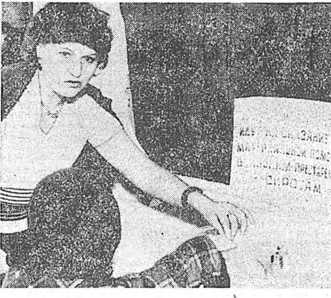
басагад II шатын инвалид хү...