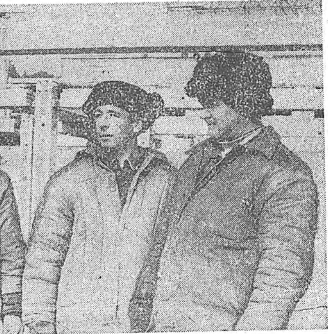
Энэ түүрү бригадада шухала энэ объекте барихынь дала-гаһанда һайшаамээр һэн. Юуб гэхэдэ, үбшэн зоной удаан хү-лэһэн диспансеры урда мэр-тэ саг сооно бариха, ашагла-гада тушаала шадха бшуу.

нэй худалмэри адги тэгшээр хэдэг. Дүршл шадбаари хэ-тэй, хоорондоо хорисаата хэ-дэн мөргөжэл шудалмэри бай-хадга, ажыхын тоосоной гу-римээр ажаллаха гэжэ шилдэгэ һэн. Түүрү энэ гурим үйлд-бэридөө нэгдээрүүлхэдэ дө-жэ абанан объектуудыз саг