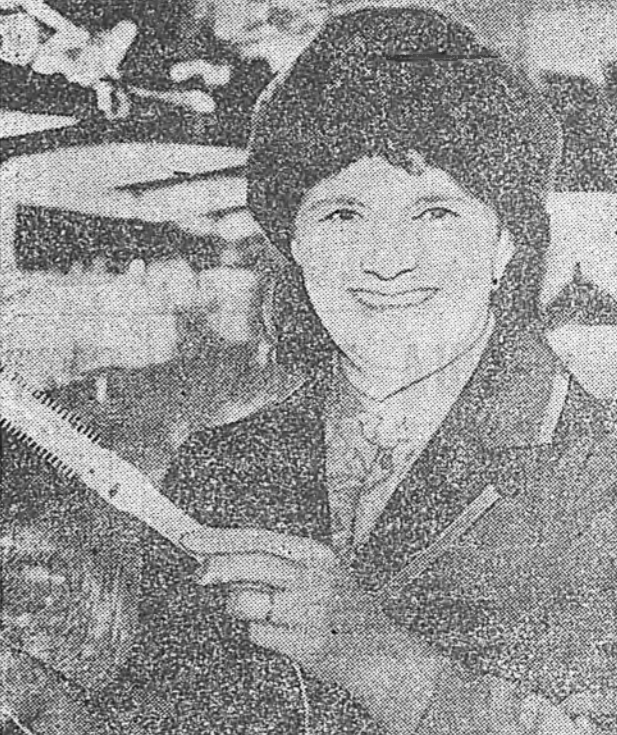
Дэшил Дэй-Льюнста эрэ хү-догол роль гүйсэхээнэнь академин гешүүд хүдөөр сэгизэ.

Энэ баяр ёһолол дөлхэйн 90 оройдо харуулагдаа, «Дорин Чондер» навлаллоно гэжэ концерте зат соо сугларалгад Австралигай, Аргентингай, Швейцаргай, эхэнэрэй гол роль найраа гүйсэхээнэйгөө түлоо Оскар шанда хүртээбэ.