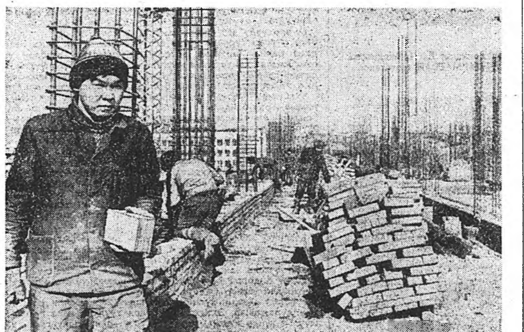
Барилгын талмайнууд дээрэ

Бэлшээрин газараар бага, үндэр баян ургаса үгэдэг сөшангагаршөө хомор, мун һүүлэй жолнуудтэ гахайнуудаа олошоруула баатай болон дээршээ энэ ажамы хонин хүргөө өсөөлшэ ушартай болоо юм. Мүнөө Тарбагатайн районой Лениной нэрэмжтэ колхоздо бүхдөө 2921 хонин, тэр тоодо 2507 эхэ хонид тоологдоно. Хонин хүргөө үсөөлөөшөө һаа, энэ халбарингаа ашаг үрине эрид дээшлүүлэхэ хэрэгтэ колхозойхид гол анхралаа хандуулаа.