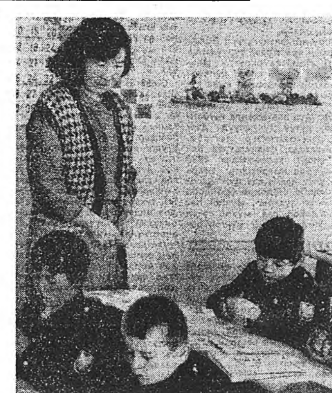
Бага хууринуудаа хэргээн хүгжөөе!