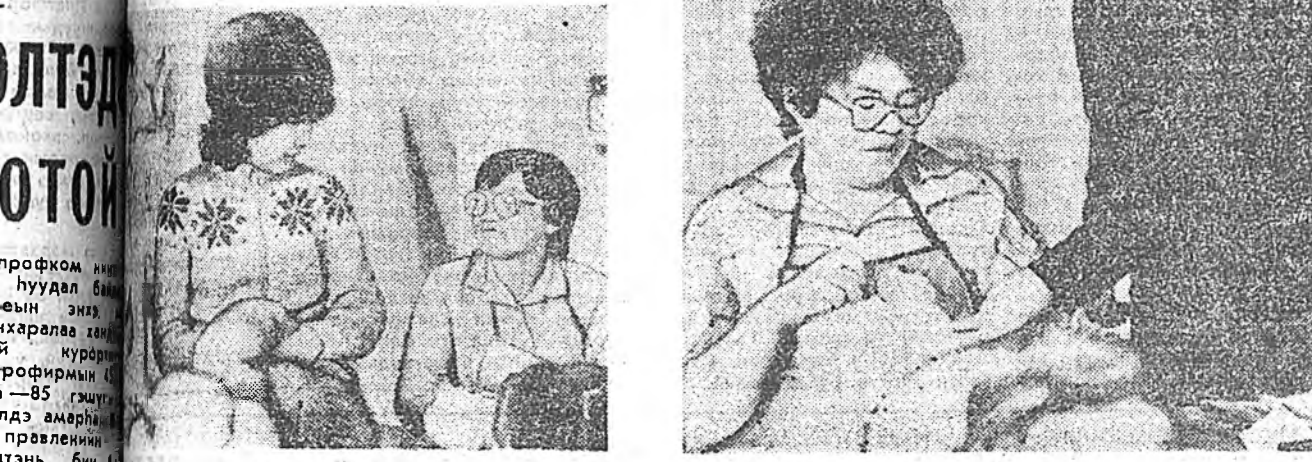
Элүүр энхын булан

Асарин ехэ хотон городуудта ажануудад хүн зоний һуудал байдалда хангалтагүй гоор нүлөөлэгдэ, дулаан ороноудта ой модо отолодог дэлхэйн үдэриё һайндэрлэгдэ зорюулжа уриданһаан һануулаха хөһөн байгаа.