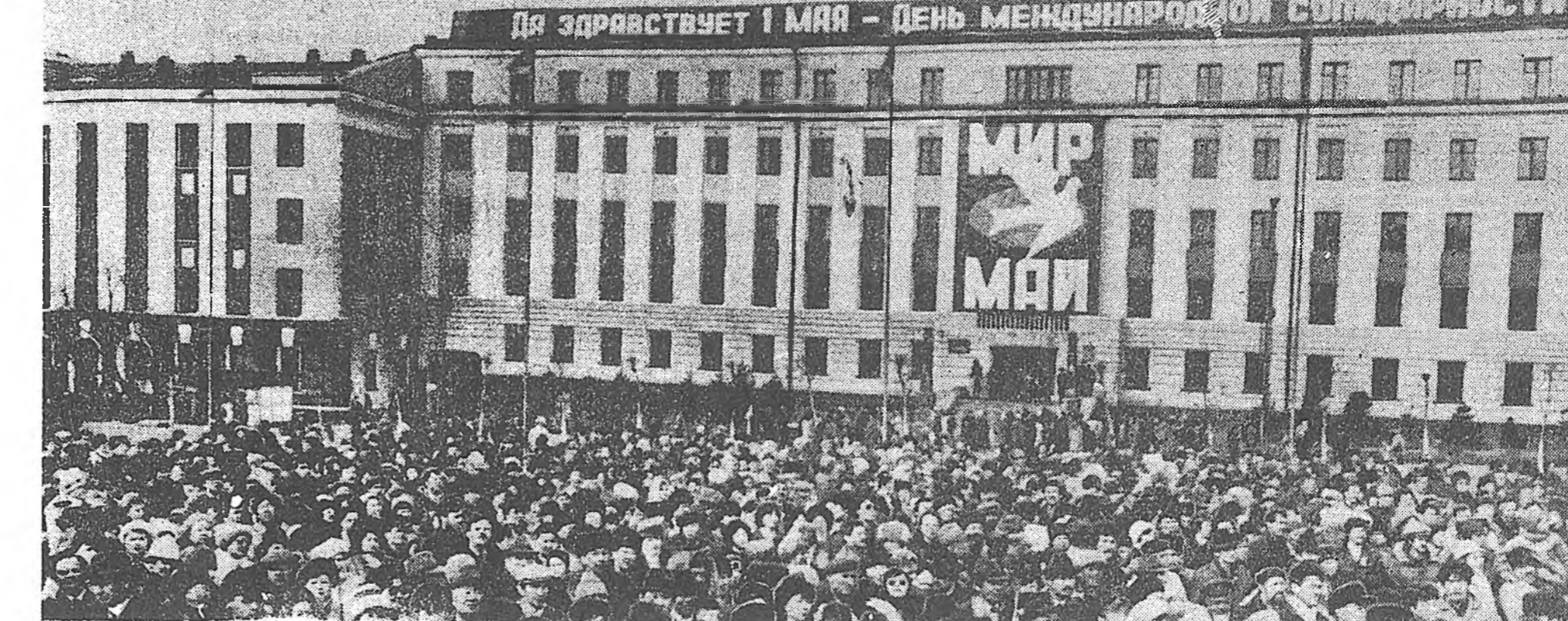
Улаан-Удын шэлэй эвдо. Баталһан хэлсээнэй ёһоор продукция худалдаха, ашаг олоо тусбүүдээ 109,2 процент дүүргэжэ...