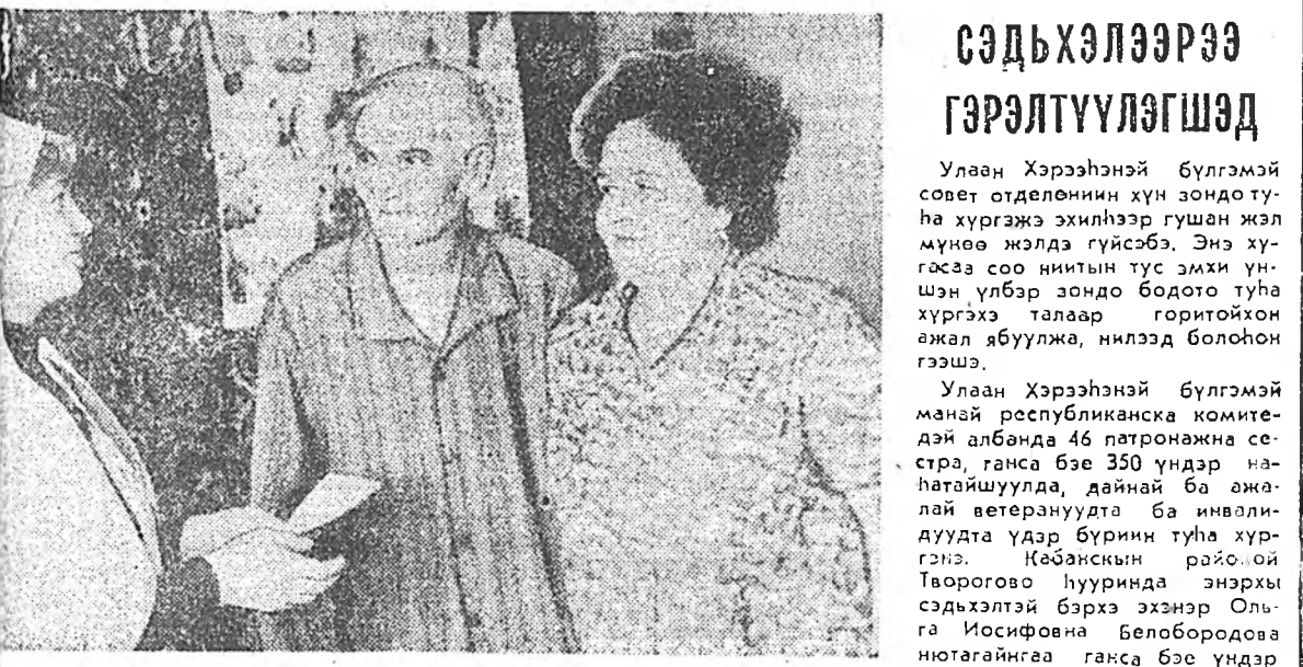
Улаан Хэрээхэй бүлгэмэй сэдьхэлээрээ гэрэлтүүлэгшэд