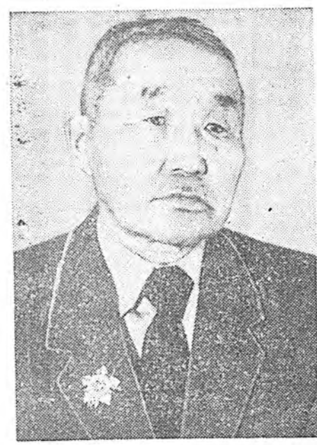
...ҺАЙХАН БАЙДАГ ҺАЙ

Ажалша, малша, анхан угһаа ангууша Алдар солон Аха нютагайи улад зон, Аян замдаш, амаралтадаш, амандаш Азтай, согтой, амгалан жарган һуугт да.