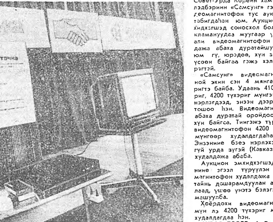
Манай хотодо түрүүшнх... ...Урлаг дээрэй. 2. Аукцион...