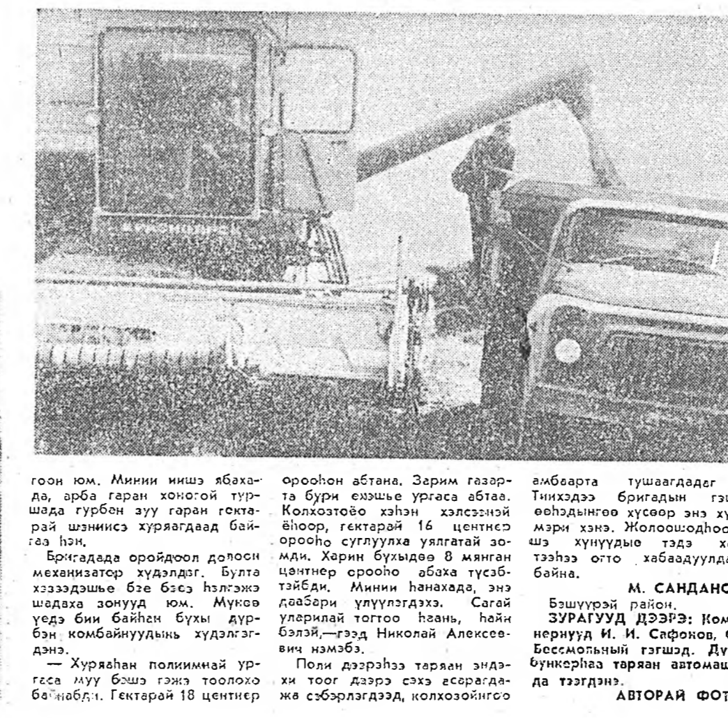
Мини иншэ ябахда, арба гаран хонор-ой туршда турбан зуу гаран гектарай шанис хурялгагад байгаа нэн.