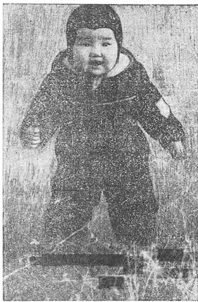
Ялан зөөлэн газар бэ!