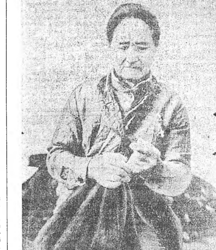
СЭНТЭЙ АРНА ТУШААНА

нөө болотор бэвүүлэгдээгүй зандаа. Тэд захирагчтар дохиолгын аргаар хүгжэлтын орбон асуудалнуудын шийдэхын аргагүй бшуу. Өөһэднөө хүгжэлтын асуудалнуудыне арад зон өөһдөө шийдэхэй аргагүй лэн. Энэ талаар хүтэлбэрин, мун болологдон мунга зөөри ху-баарилгын асуудалнууд ямар нэгэн албан зургануудта дэлгэгдэдэг байгаа. Тийн эдэ албан зурганууд эдэ даба-хэриг ямаргаар бэлэулжэ бай-наб гэжэ бодотору хинагда-даггүй лэн.