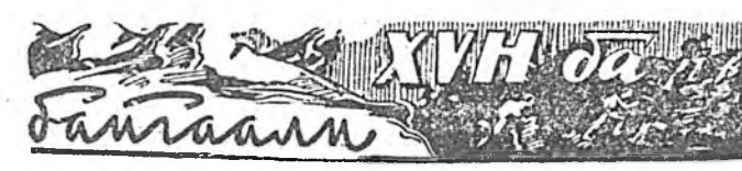
ХVH да байгалин

Бодожо, Гажуу мангасай хүнэйэн Галаба үгэ аалжай гэнэ Таняад,