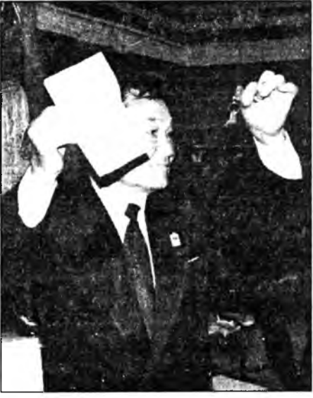
"Морена", "Полистройдеталь", "Бурятвторчермет" гэжэ акционернэ бүлгэмүүд, республикын Промышленно-худалдаа наймаанай палата мүн лэ мунгэ зөөрээр туйлахан, шангуудые тогтоохон байха юм.