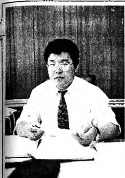
Түрэл хотымнай ажабайдалга, ажал хэрэгүүдтэнь зориулагдана тусхай гурба дахи хуудагданга манай корреспондент В.ШАГДУРОВАЙ асуудалнуудта городской Советэй түрүүлэгшэ Б.Ц.ДЫМ-БРЫЛОВ харюусана.

— Бимба Цынденевич, 1997 оной хахад жэлын үнгэршэбэ. Энэ хугасаага хэгдээн ажалай зарим тэды гүнгүүд тухай тобшохоноор хөөрөжэ үгэхыетнай гуйха байна.