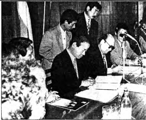
ЗУРАГ ДЭЭРЭ: Аньян хотын мэр Ли Суок Ёнг үгэ хэлэнэ; гар табилгын үедэ.

Улаан-Үдын мэрэй уялганууды дүүргэгшэ В.К.Васильев ба Аньян