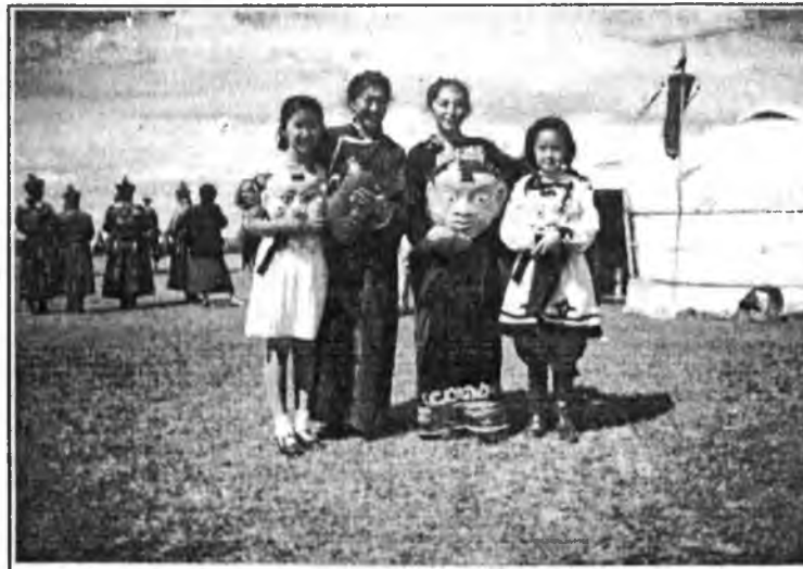
Бурхадай хатар гүйсэдхэгшэд