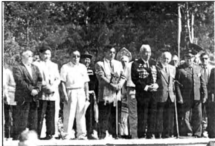
Амаршалгын үгэ хүндэтэй