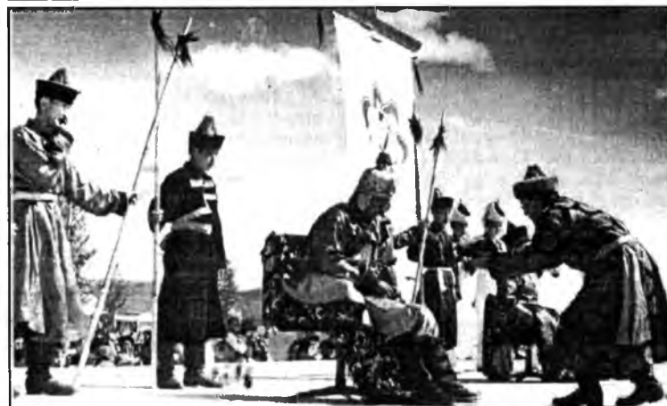
Бабжа Барас баатарга - төөлэй