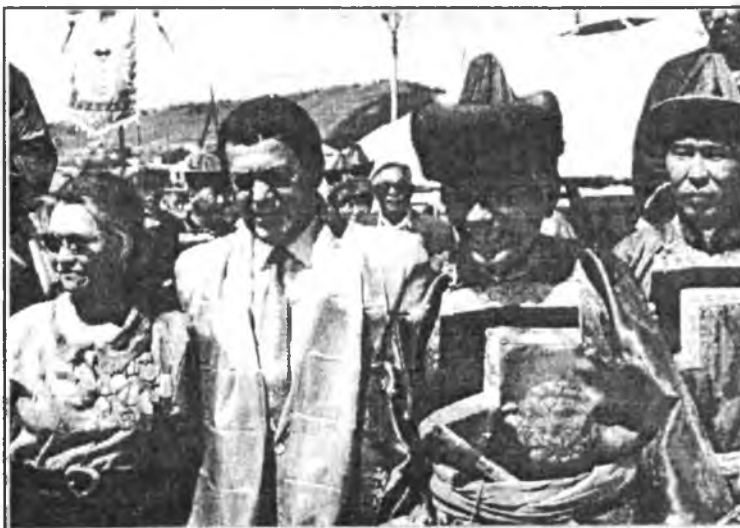
И.Кобзон найр нааданда

Б.ГЫНДЫНЦЫРЕНОВ. Улаан-Үдэ - Ага - Улаан-Үдэ. АВТОРАЙ, Ж.БАЛДАНОВАЙ фото.