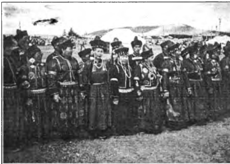
Сагаан Шулуутайн арадай аман зохёолой бүлгэмэйхид