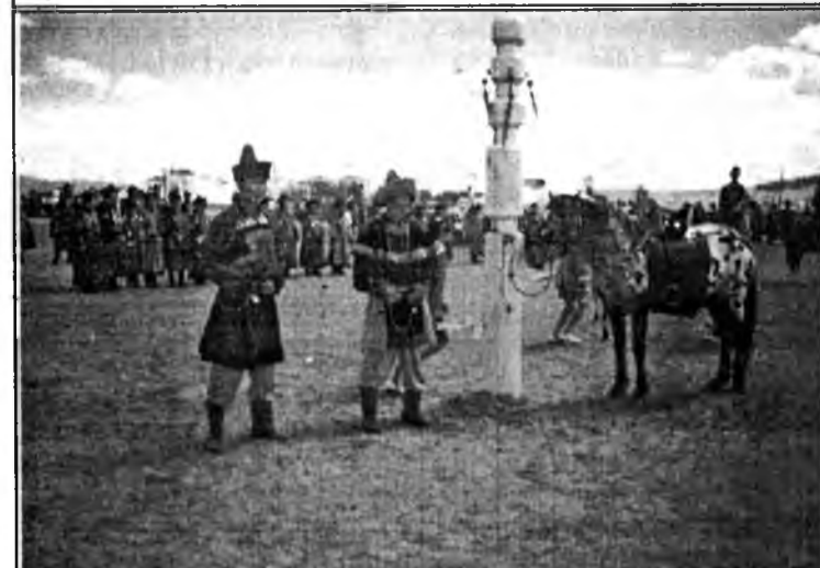
Сэгээн найхан сэргын дэргэдэ