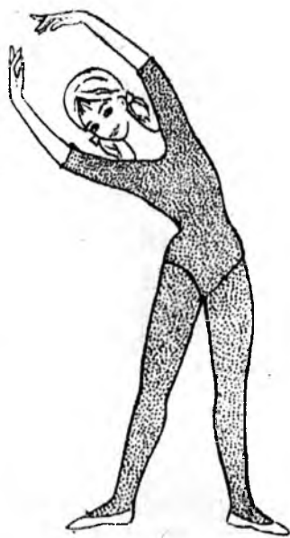
Тус зүбшэлнүүдые Д.ЭРДЫНИЕВА бэлдэбэ.