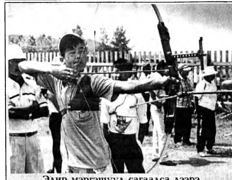
Эдир мэргэшүүл сагаалса дээрэ

Агын округой жабхаланта 60 жэлэй ойн баярые аглаг найхан Ага нютагай араг үргэн дэлсэтэйгээр тэмдэглэжэ гараба. Июлиин 4-5 – най үдэрнүүдтэ округой түб хууринда заншалта зунай наадан "Сурхарбаан-97" болон Агын 60 жэлэй ойдо зорюулагдан соёлой болон спортын ехэ найрта үнэхөөрөө түмэн зон сугларһан байна.