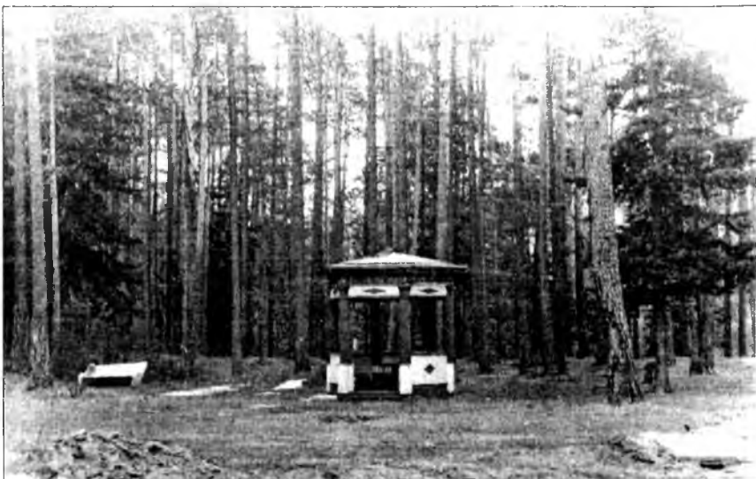
Хүнүүдэй амардаг беседкэ