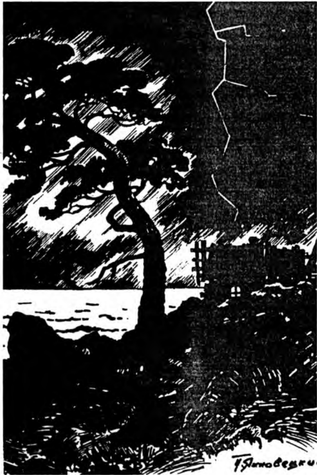
Сахилгаан дурта аадар... П.ЯХНОВЕЦКИН зурал.