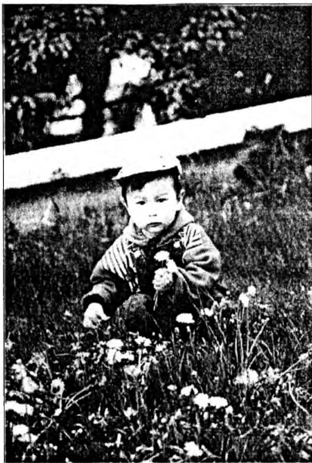
"Буряад орон" - 97 Сэлгээ хайхан гайдагаа Сэсэг түүхэдэ гоё даа.