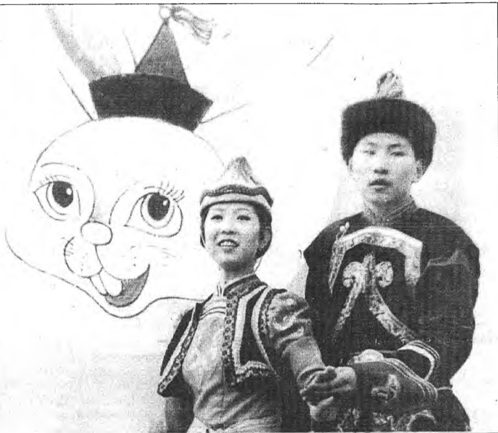
САГААЛГАН ШАГАЕЛ ПУ БУРЯТИИ.