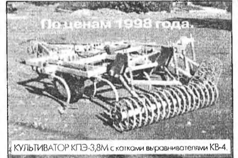
КУЛЬТИВАТОР КПЭ-3,8М с катками выравнивателями КВ-4.

Применение культиватора КПЭ-3,8М с КВ-4 позволяет отказаться от дискования и боронования полей. По данным ОПКТБ Сиб ИМЭ (г. Новосибирск) в Западной Сибири от этих операций отказались. Очистка поля от сорняков по данным опытной эксплуатации в Бурятии достигает