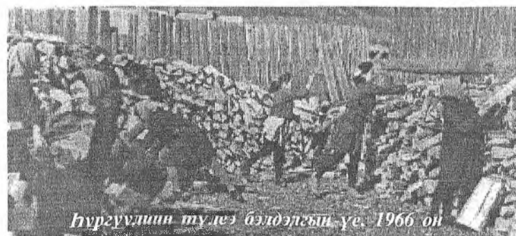
Хургуулийн түлээ бэлдэлгын үе, 1966 он

М АНАЙ Цахирай интернат хургуулийн 40 жэлэй ойи баярай найдэрэй болохоёо байхада, түрэл хургуулия, эндэ хүдэлхэн багшанараа болон хуража гараан хурагшадаа домоглон нанан дурсажа, сэдхэлэйнгээ гүнзэги үгэнүүдые бэшэхые хүсэбэб. Хургуулимнай 1959 оной июниин 15-да нээгдэһэн юм. Тэрэ сагта Захаамин аймагаймнай нютаг нуга бүхэнһөө, мүн хүршэ Зэдэһээ үхибүүд ерэжэ, эхин классуудта хуража эхилээ бэлэй. Эгээ түрүүн 120-ёод үхибүүн 1-4 классуудта ороо хэн.