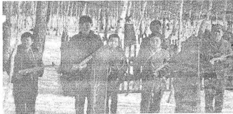
«Зарница» нааданда хабарадагшад (1973 он)