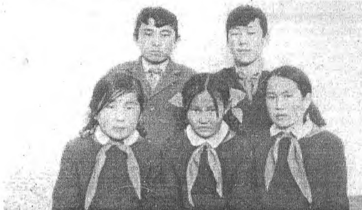
7-даху классий хурагшад, 1971 он