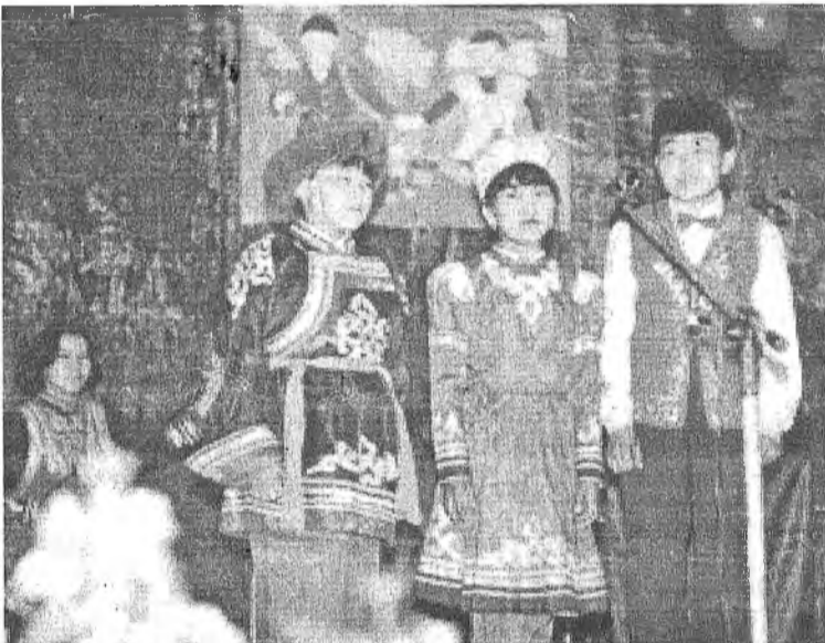
«Ургы» ансамблийн дуушад