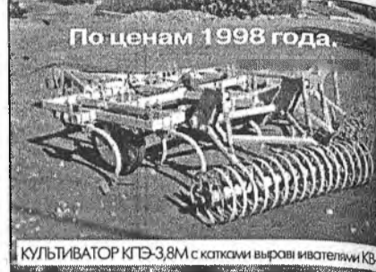
По ценам 1998 года. КУЛЬТИВАТОР КПЭ-3,8М с катками выравнивателями КВ-4

Выпускаемый заводом культиватор КПЭ-3,8М разработан на основе серийного культиватора КПЭ-3,8. Модернизация культиватора произведена для возможности (и необходимости) установки катков выравнивателей КВ-4. Культиватор рыхлит почву и подрезает сорняки, катки-выравниватели измельчают почву, выравнивают поверхность поля, вычесывают сорняки и разбрасывают их на поверхности поля, при этом стебли сорняков плющатся вдоль стебля, что не дает им в дальнейшем прорасти. На глубине 3-4 см. создается уплотненный влагосберегающий слой, что обеспечивает при дальнейшем посеве стабильную глубину заделки семян (что исключает «выгон»). Применение культиватора КПЭ-3,8М с КВ-4 позволяет отказаться от дискования и боронования полей. По данным ОПКТБ Сиб ИМЭ (г. Новосибирск) в Западной Сибири от этих операций отказались. Очистка поля от сорняков по данным опытной эксплуатации в Бурятии достигает 95-98%.