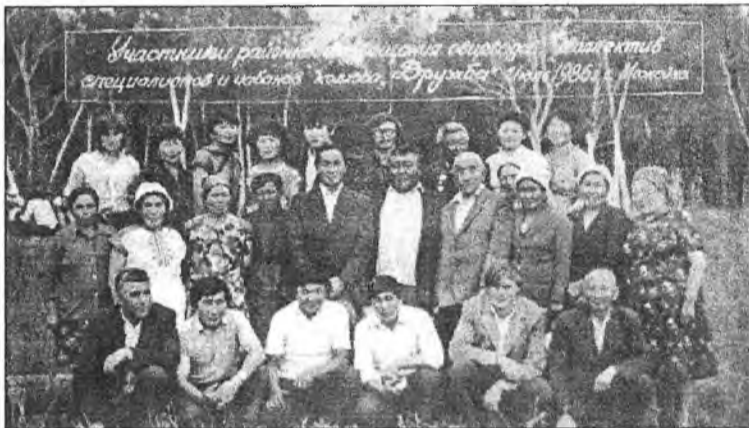
«Дружба» колхозой мэргэжлэдэй, хонишодой коллектив – аймагай зүблөөндэ хабаадагшаг (1986 он)