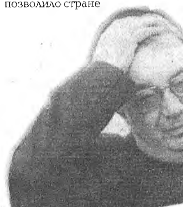
"Перед лицом товарищей торжественно обещаем..."

3. «Я считаю, что правительство, которое будет создано, должно особое внимание сегодня уделить единству России. Да действительно, это наше большое завоевание... Следующий вопрос - формирование кабинета. В правительстве могут входить представители различных партий, но не как представители различных партий, а как люди, которые имеют свои внутренние, так сказать,