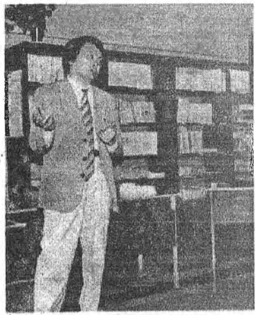
Буряадай Уран зохиолшодой холбооной