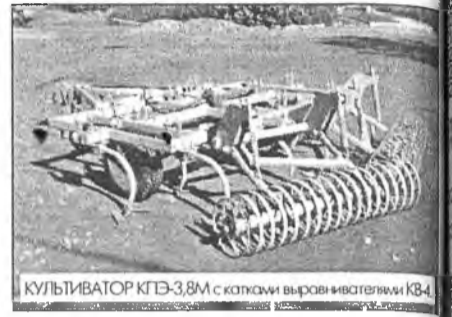
КУЛЬТИВАТОР КПЭ-3,8М с катками выравнивателя КВ-4.

Выпускаемый заводом культиватор КПЭ-3,8М разработан на основе серийного культиватора КПЭ-3,8. Модернизация культиватора произведена для возможности (и необходимости) установки катков выравнивателей КВ-4. Культиватор рыхлит почву и подрезает сорняки, катки-выравниватели измельчают почву, выравнивают поверхность поля, вычесывают сорняки и разбрасывают их на поверхности поля, при этом стебли сорняков плюются вдоль стебля, что не дает им в дальнейшем прорасти. На глубине 3-4 см. создается уплотненный влагосберегающий слой, что обеспечивает при дальнейшем посеве стабильную глубину заделки семян (что исключает «выгон»). Применение культиватора КПЭ-3,8М с КВ-4 позволяет отказаться от дискования и боронования полей. По данным ОПКТБ Сиб ИМЭ (г. Новосибирск) в Западной Сибири от этих операций отказались. Очистка поля от сорняков по данным опытной эксплуатации в Бурятии достигает 95-98%. Эффективность применения КПЭ-