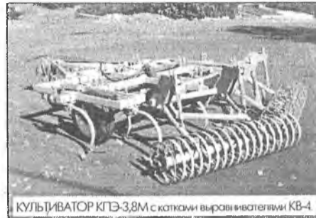
КУЛЬТИВАТОР КПЭ-3,8М с катками выравнивателя KB-4

Выпускаемый заводом культиватор КПЭ-3,8М разработан на основе серийного культиватора КПЭ-3,8.