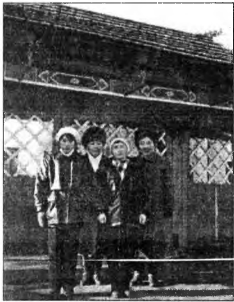
Гуманитарна шэглэлэй предметүүдээр үнгэргэгдэнэн республиканска олимпиадын 2-дохи турай һүүлээр Оһын