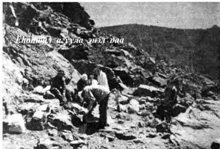
Ёһотой агуула энэл даа