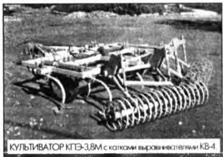
КУЛЬТИВАТОР КПЭ-3,8М с катками выравнивателями КВ-4

Выпускаемый заводом культиватор КПЭ-3,8М разработан на основе серийного культиватора КПЭ-3,8. Модернизация культиватора произведена для возможности (и необходимости) установки катков выравнивателей КВ-4. Культиватор рыхлит почву и подрезает сорняки, катки-выравниватели измельчают почву, выравнивают поверхность поля, вычесывают сорняки и разбрасывают их на поверхность поля, при этом стебли сорняков плющатся, что не дает им в дальнейшем прорастать. На глубине 4 см. создается уплотненный влагоберегающий слой, что способствует при дальнейшем уходе стабильную глубину зоделки (что исключает «выгон»). Применение культиватора КПЭ-3,8М с КВ-4 позволяет отказаться от боронования и боронования полей. По данным ОПКТБ Сиб ИМЭ (г. Новосибирск) в Западной Сибири от этой операции отказались. Очистка от сорняков по данным опытной эксплуатации в Бурятии достигает 95%. Эффективность применения КПЭ-