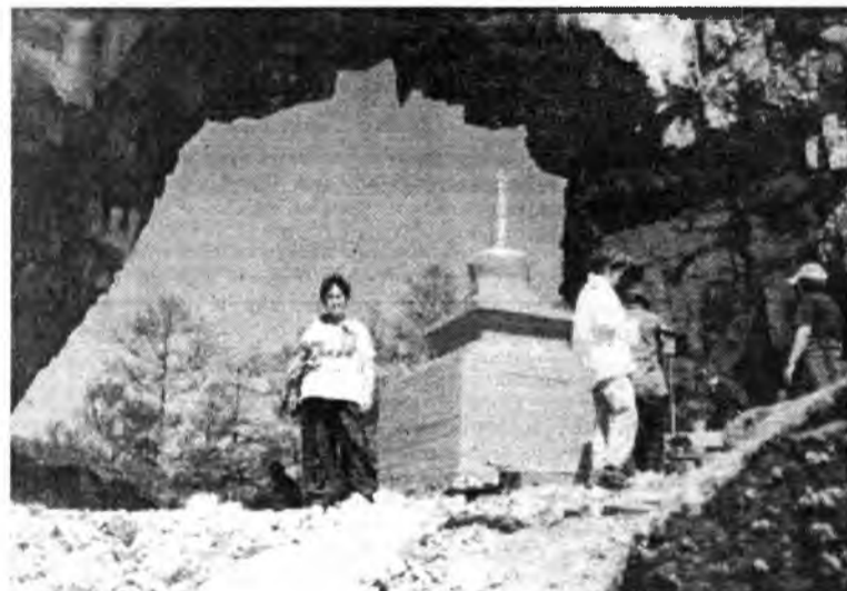
Үүдэн сүмэ дэргэдэ