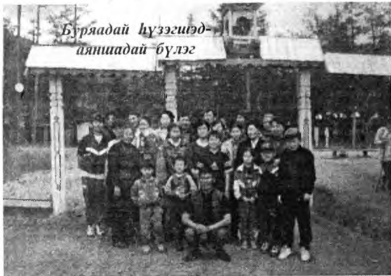
Буряадай хүзүүгээд- аяншадай бүлэг