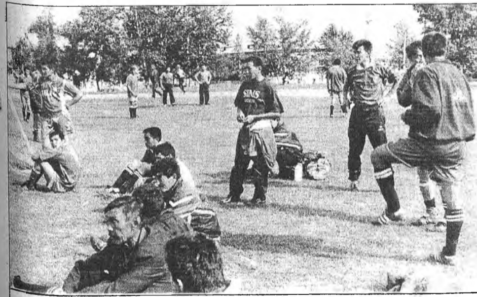
Забһарай үедэ амараад абахаар