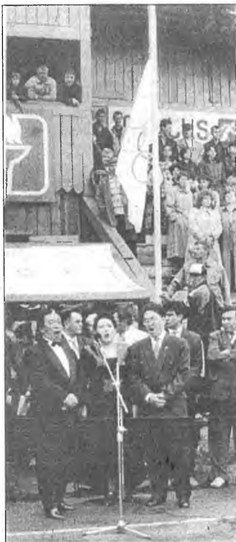
Буряад Республикын гимн гүйсэдхэгдэнэ