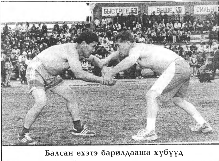
Балсан ехэтэ барилдааша хүбүүд

Хүдөөгэй аймагуудай дунда болоһон мурьсөөнэй түгэсхэлэй уулзалга тон һонирхолтойгоор үнгэргэгдөө. Эндэ Түнхэнэй ба Хэжэнгын футболистнууд наадахан байна. Нааданай эртэ эхилбэшье харагшадтай олоор сугларһаниинь гайхалтай байгаа.