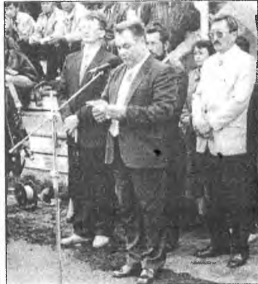
Хүдөө ажахын болон эдэс хоолой министр П. М. Болонев үгэ хэлэнэ

Зунай хүдөөгэй 8-дахи спортын наадануудай туг үргэхэ хүндэтэй уяалга Ю.И.Воеводин (Загарай) И.Н.Федосеев (Зэдэ) хоёрто даалгагдаа. Эпээнэй хажуугаар арадай фольклорно «Прибайкалье» гэхэн ансамбль, агаарай досантын сэрэгэй алба хаагшад, мүн бэшэшье ураг найханай бүлэгүүд һайндэр нээлгыэ шэмэглээ. Удаань одоол спортын нааданууд эхисэ абажа, хоер үдэрэй турнада харагшадай анхарал ехээр татаһан байна һэн. Спортын наадануудай программада хэдэн зүйлнүүд, тэрэ тоодо волейбол, футбол, хүнгэн атлетикэ, гири үргэлгэ, һур харбалга, бүхэ барилдаан