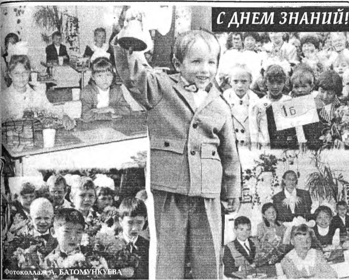
Фотоколлаж А. БАТОМУНКУЕВА