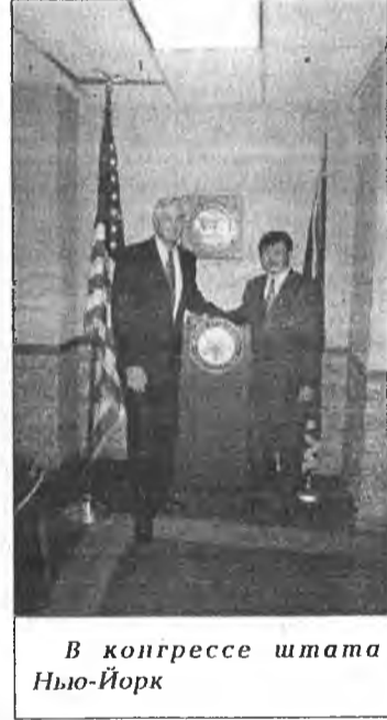
В конгрессе штата Нью-Йорк

Власть денег. Бессилие власти. К этому привыкли. Изменить жизнь своей родины... Спасти свой народ... - Это звучит наивно. Если не верить в оптимизм молодости. Поговорим о реальном. И.ПРОНЬКИНОВ.