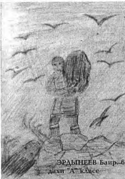
Оля РИНЧИНОВА, 6 класс