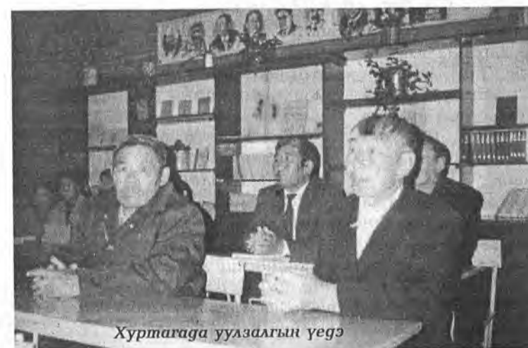
Хуртагада уулзалгын үедэ