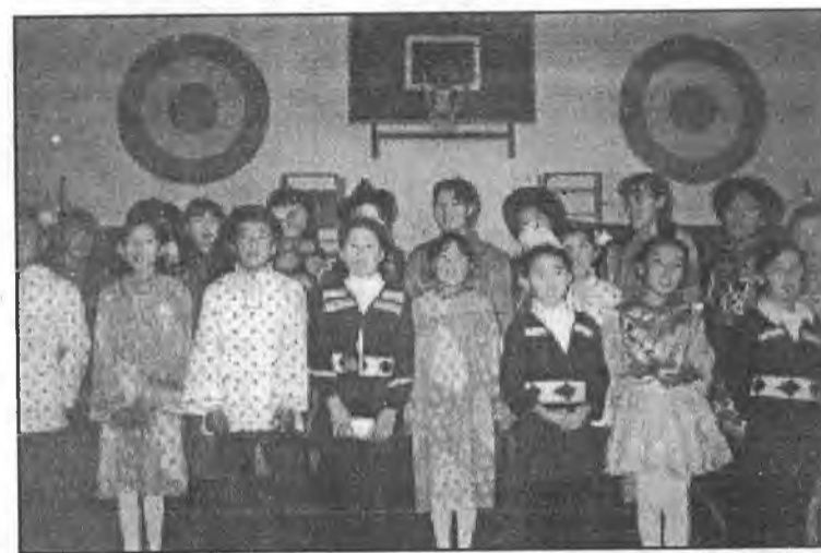
Хонгёо дуугаа зэдэлүүлэе