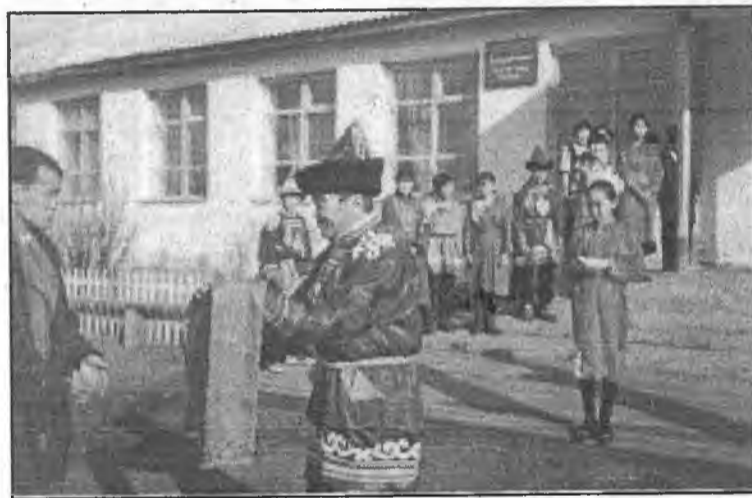
Утаата гээрэ угтабал даа...