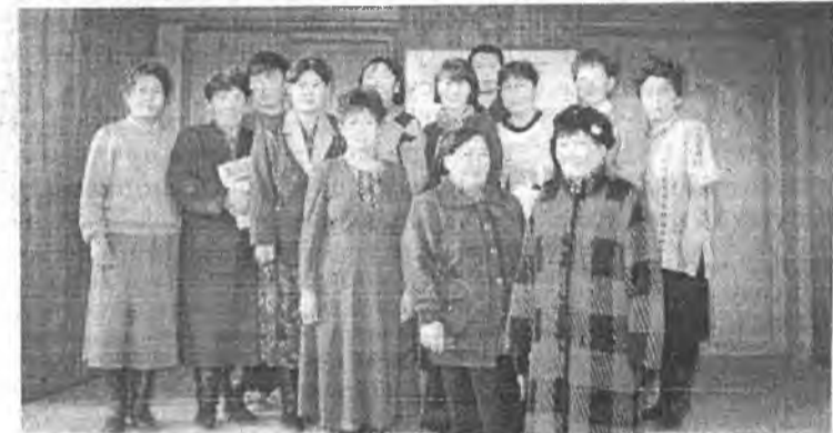
Үлэгшэнэй гунга хургуулин багшанар

Хурдан хүлэгтөө мордож Хуртага руу шуумайбади. Хэргыдаа мантан томо Михайловка тосхоние үнгэржэ дардам асфальт харгыга бариһаар ябатаргаа, Бурга