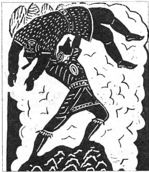
Заса-Мэргэн и Шара-Хасар.