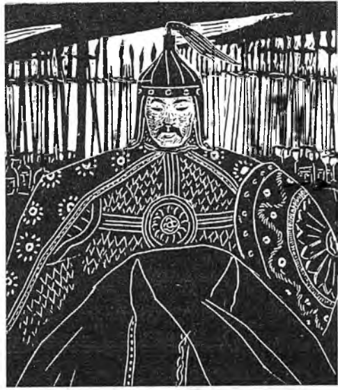
Гэсэр с войском. Рис. А.Сахаровской.

Ведь после Гая Юлия Цезаря Римом стали править императоры, которые стали называться цезарями, не зная даже о том, что это древнейший восточный титул владык народов и земель.