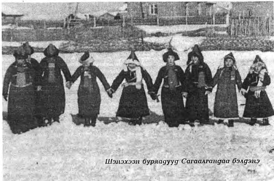
Шэнэхэн буряадууд Сагаалгандаа бэлдэнэ

Бута хоогэй сагуур Бүн-бүнхэн гүйдэлтэй Борохон Туулай жэнай Бусажа хооргөө далана. Хурмаста тэнгэрийн сэгээндэ Хүршэгэнэн, хүнхэнэн байдаг Хурбаагай эзэн Луу жэл Хүрөөд мүнөө ерэбэл даа. Ази түбийн буряад—моигол Арад зоноо амаршалан, Анханайнгаа ёно гуримаараа Амар амгаланууе хүргэнэб! Наһан дээрээ наһа нэмэжэ, Наһатан бууралайнгаа үрээлээр Нааган зугаагаа дэлгээжэ, Наяран сэнгэн угтаял даа! хүни, үдэр илгаралгүй, хүн сагаан сэдхэлые үбэрлэжэ, хүзэг зальбаралые дагадхаад, хүр хүлдэ үргэгдэг лэ! Буряад арад зон гээшэ Бууса тоонто гуламтагаа Бурхан шажан шүтөөнтэй, Буурал дээдын буянтай. Заи найнтай буряад зоной Заяанай заншал заабариуе Залуу үетэндэ захижа, Залгамжалхымни зүбшөөгым!