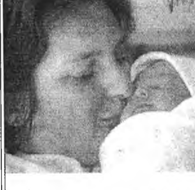
На планете родился 6-миллиардный ребенок.