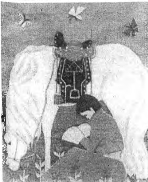
Шэнэхэн буряадуудай ажабайдал харуулһан зурагууд