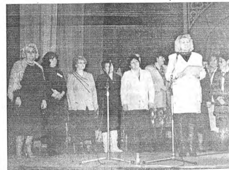
Выпускники 70-х годов