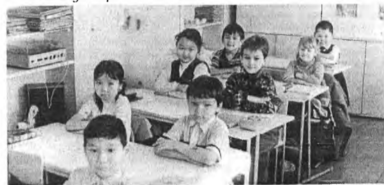
1 "б" класс: "Учимся с удовольствием!"