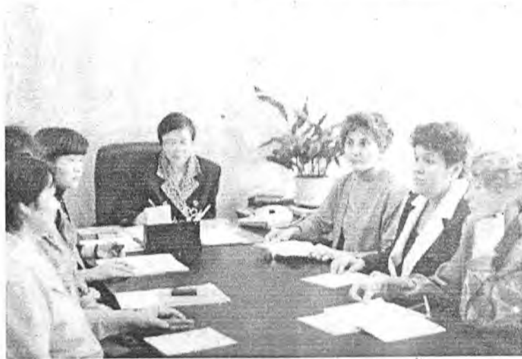
В кабинете директора